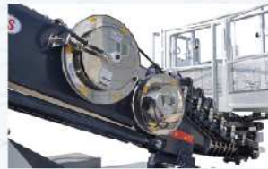
녹방지 서스릴 장착