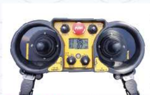
리모컨 LCD 적용