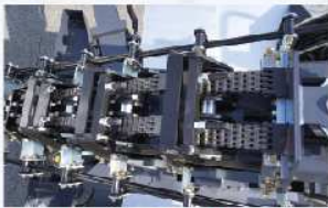
볼 인입 / 인출 올체인 적용