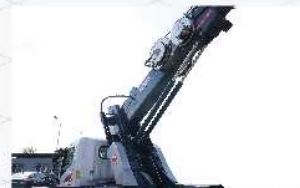
더블 데릭 실린더 장착