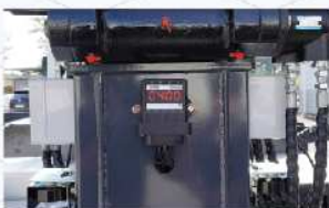
무게확인이 수월한 탑승함 무게 모니터