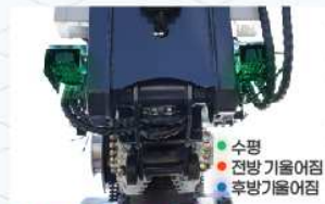
탑승함 수평 LED 램프