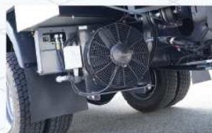
하절기를 위한 작동유 콜러장착