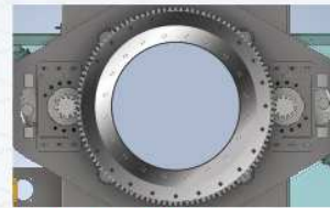
안정적인 더블감속기 적용