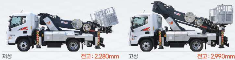
저상 전고: 2,280mm 고상 전고: 2,990mm