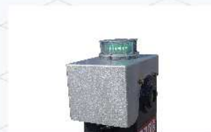
안전을 위한 아우트리거 램프 장착